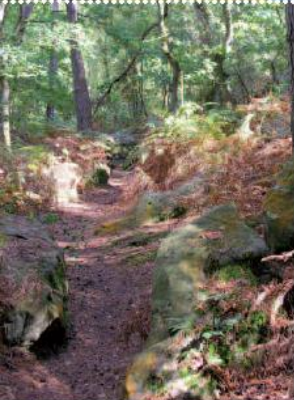
Le chemin de la Goultière en automne

(10) La Folie Ménard : le terme de folie pourrait faire référence aux monuments mégalithiques ou aux lieux de cultes païens qui auraient été détruits au début de notre ère.