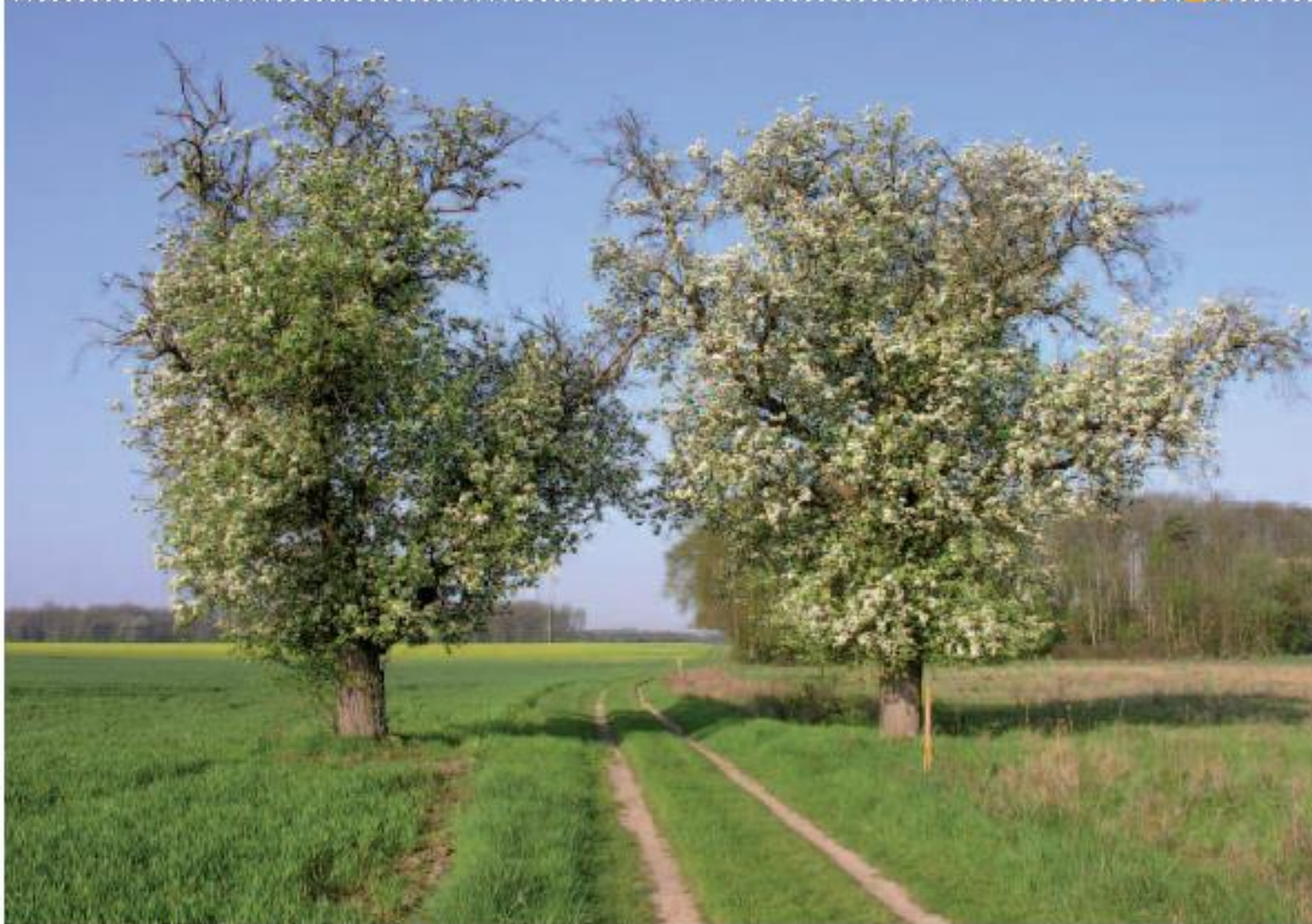
“Poitiers-sentinelles” sur le chemin aux Belles Croix

appelé champtier des Vieilles Vignes (5) , prendre le premier chemin à gauche, puis à la première intersection, de nouveau à gauche. Le chemin devient un « chemin creux ». Continuer tout droit sur environ 250 m jusqu'à la route goudronnée.