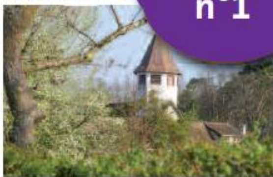
Ferme de la Trouverle au printemps