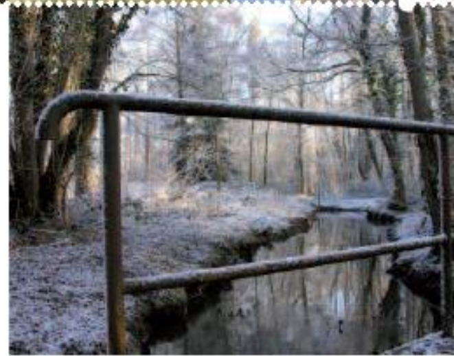
Frimas sur la sente de l'Orme