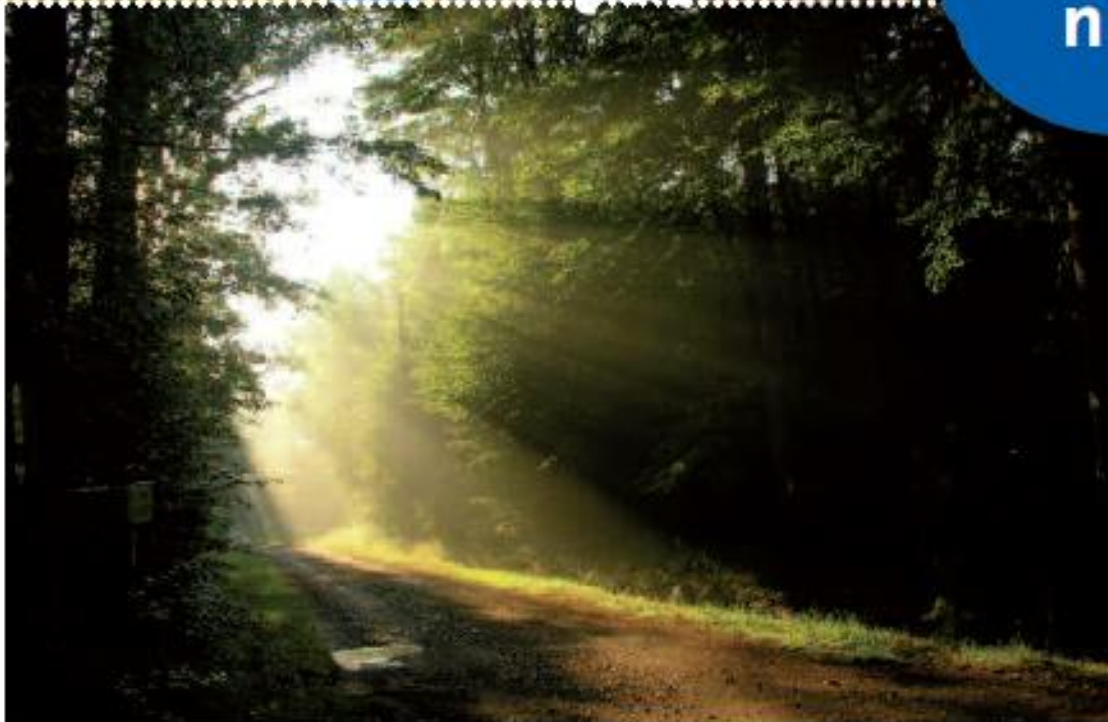
La lumière pleut sur le chemin de la Goulbaudière