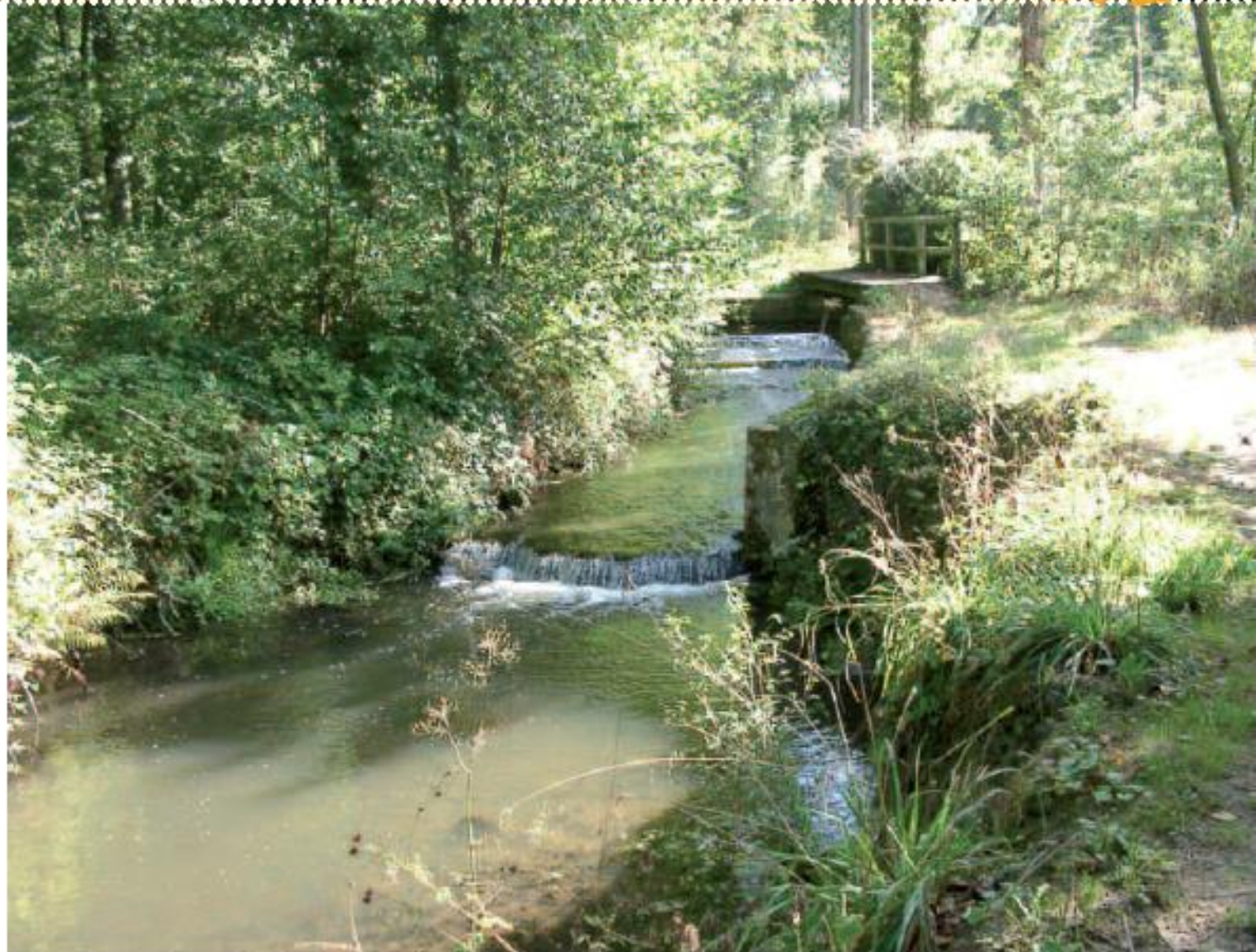
L'une des passerelles du Gué Fallot en été

Continuer toujours à travers la forêt. Vous arrivez sur le plateau. À la première intersection, prendre à gauche. Vue sur le Bols Dieu (5) . La descente s'accroît dans la traversée du bois, ensuite le chemin remonte. Au premier carrefour, prendre à gauche. Sur votre gauche, vue sur la Folle Ménard (6) et, sur votre droite, vous longez une propriété privée plantée de hauts thuyas. Prendre le deuxième chemin à droite jusqu'à la route des Chaises.