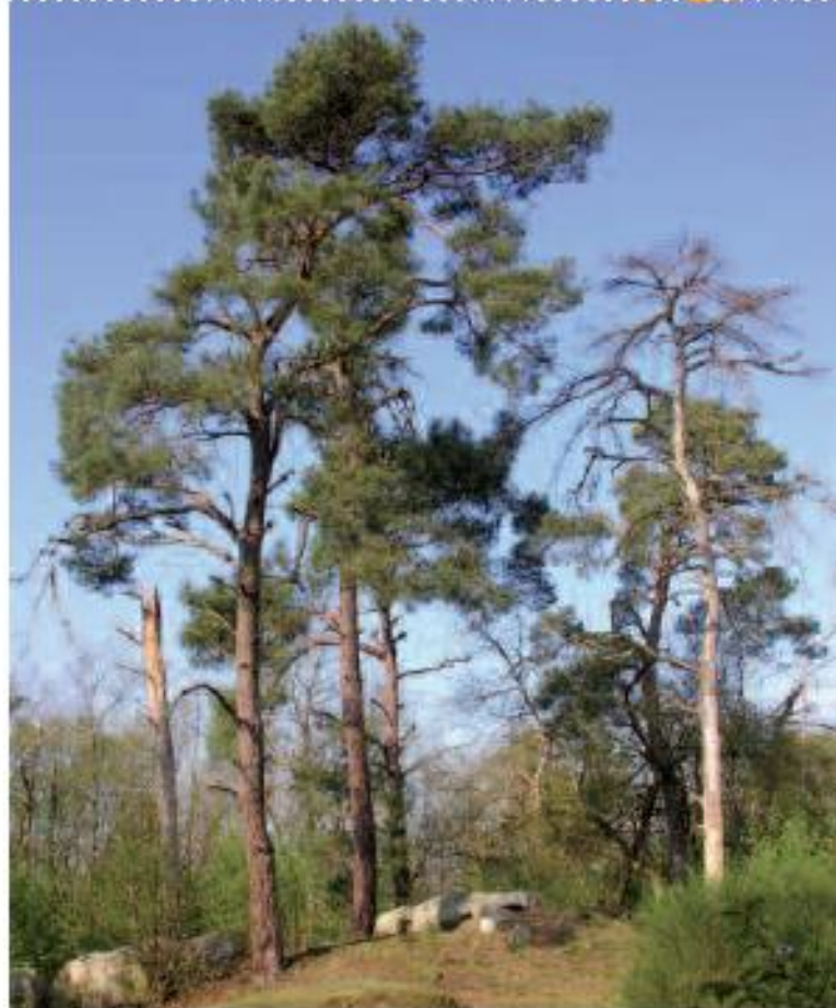
Le Rocher de Raizeux en été

Au bout de la sente, prendre à droite le chemin caillouteux. A la fourche, prendre à droite, et ensuite le premier chemin à gauche. Ce chemin, profond, est un fossé celtique (11) . Il remonte ensuite et croise un chemin que vous prenez à gauche. A la fourche, continuer tout droit et rester sur la droite du chemin. La descente commence et vous arrivez sur la plaine des Vallières. Continuer tout droit jusqu'à la route des Vallières. Traverser et prendre à gauche le