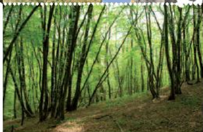
Châmes de la Butte Lomlière